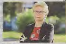
La Defensora Anna Moilanen.

La Defensora explicó que los funcionarios de estos departamentos deben atender una media de entre 450 y 500 correos electrónicos que les remiten los ciudadanos, frente los aproximadamente 100 de antes de la pandemia, por lo que se ha multiplicado casi por cinco el tiempo que deben destinar a la atención de los requerimientos y las peticiones que les hacen los ciudadanos