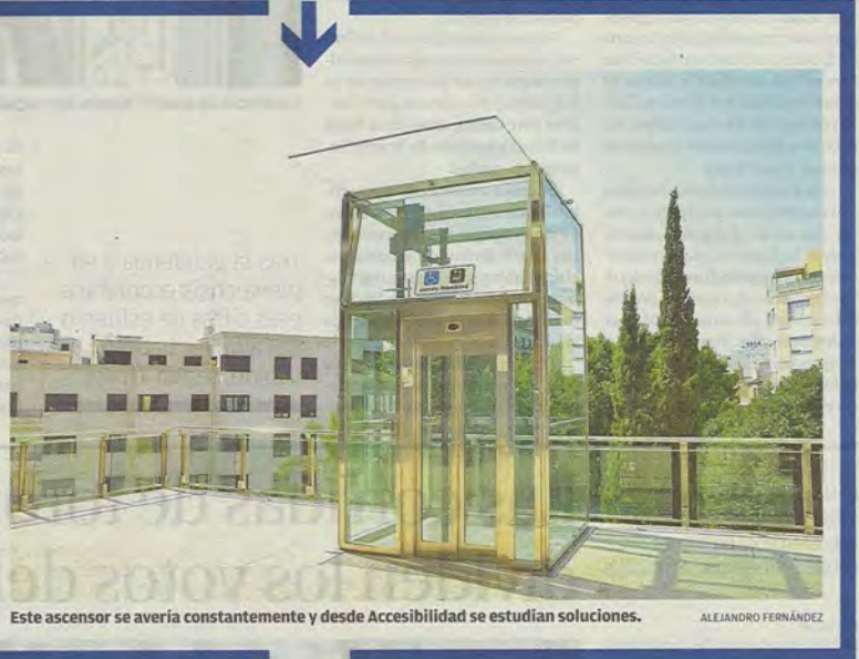
Este ascensor se avería constantemente y desde Accesibilidad se estudian soluciones.