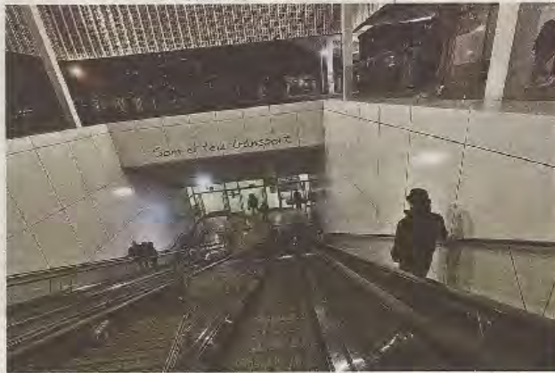
Acceso a la estación intermodal, situada en la plaza España.

Ambos defensores tienen previsto reunirse con el jefe de la estación intermodal en cuanto haya sido nombrado. La nueva conta-