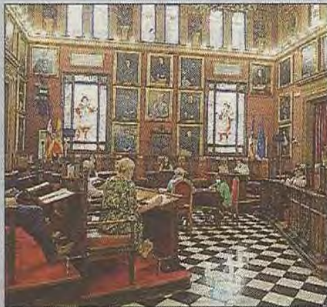
Una comisión celebrada ayer.

danos. Ha participado en cincuenta comisiones del pleno y han remitido más de 1.000 peticiones de información las distintas concejalías y departamentos municipales. Muchos de los expedientes trabajados se han convertido en recomendaciones . Entre los logros alcanzados en este periodo destacó la celebración del primer encuentro de defensores locales , la creación de la figura del defensor adjunto y la creación de la comisión de ruidos y salud . Puso de manifiesto la incongruencia que supone el hecho de que sea más fácil cambiar una ley como la de Capitalidad que modificar un reglamento o una ordenanza municipal. A su oficina llegan reclamaciones de ciudadanos de otras poblaciones y de otras administraciones y todas ellas son atendidas, aunque no sean de su competencia.