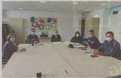
La Defensora participó en una mesa de seguridad.