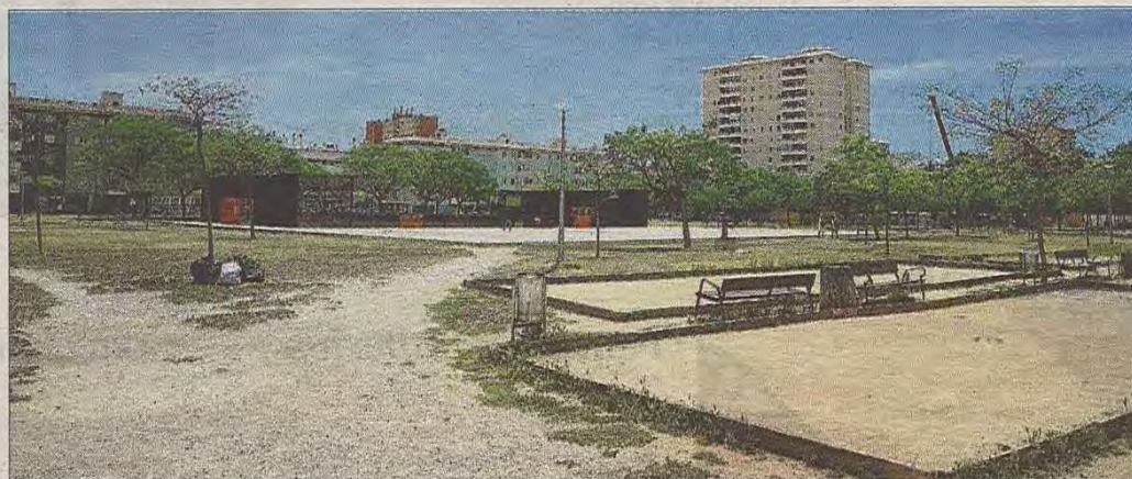
Vista general de la zona que se conoce popularmente como parque wifi, en el Nou Llevant.