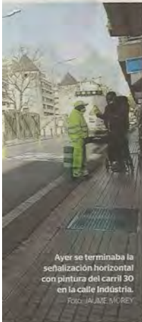
Ayer se terminaba la señalización horizontal con pintura del carril 30 en la calle Indústria.

que la mitad del coste total de la obra será asumido por el CSIC, una Agencia Estatal. «Tenemos un edificio de interés autonómico, pagado al 50% entre el Govern, con fondos europeos, y el Estado que, sin saberlo muy bien por qué, acaba dentro de los 30 millones de euros de Capitalidad de Palma», denunció Pomar.