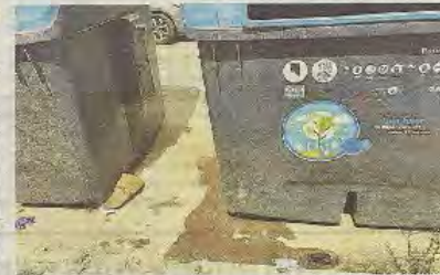
Rosto de orín entre los contenedores.