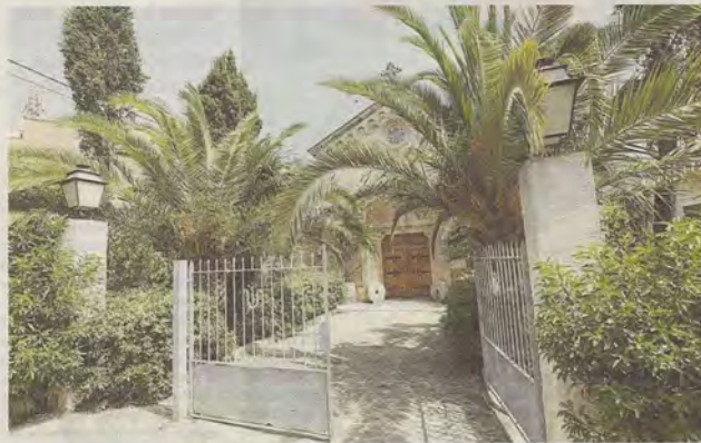
Barreras instaladas en 2016, después de que el Obispo registrara este espacio a su nombre.

Como respuesta a sus reclamaciones y, tras la inmatriculación por parte del Obispo de Mallorca, Cort sí procedió a cortar los suministros públicos de agua y alumbrado que hasta el momento tenía la plaza, prueba, según los vecinos, de que era un lugar público. Añaden que el hecho de que en este lugar haya bancos y otro mobiliario urbano también demues-