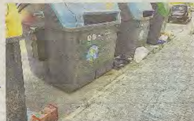
Bolsas de basura y otros residuos dejados en la calle.