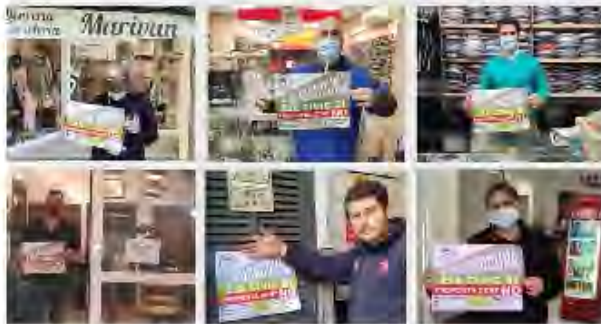
Comerciantes que se han adherido a la campaña.