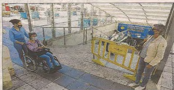
En la imagen superior, un okupa vive bajo las escaleras. Abajo, las vallas que impiden la entrada a las galerías.