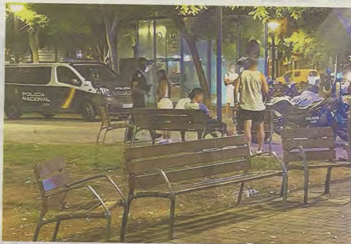
Imagen de archivo de una actuación policial contra un botellón el pasado verano en Palma.

La primera ordenanza contra el botellón, la de 2011, prohibía las concentraciones que alterasen gravemente la convivencia ciudadana,