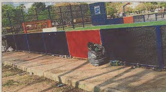
El parque amanece cada día con botellas en el suelo y mucha suciedad.

Los residentes, que temen dejar a sus hijos que vayan al parque solos, no entienden «por qué hasta ahora el Ajuntament no ha destinado dinero a un vallado que, no resolvería todos los problemas, pero sí ayudaría a que descendieran las concentraciones para hacer botellón, el trapicheo o las peleas».