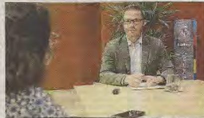
El primer edil de Palma, en su despacho, durante la entrevista.

«Escuchamos bastante, si no, no estaríamos gobernando una segunda legislatura».