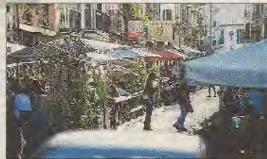
Las calles de Santa Catalina, con aglomeraciones de personas.