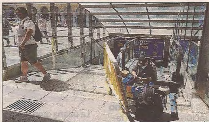
Operarios del Ajuntament empezaron ayer por la mañana el arreglo de las escaleras mecánicas que bajan hasta las galerías.

Jarabo se refirió en concreto al caso del ascensor situado en la Plaça Major, junto a las escaleras que dan a Vía Roma, el único que comunica directamente con el aparcamiento: «Es un ascensor