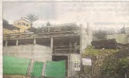
Imagen de las obras de uno de los aparcamientos que critican los vecinos.

La obra tiene licencia, pero los vecinos estiman que el permiso no debería haberse concedido.