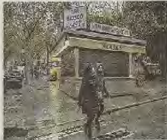
La concesión del Bar Alaska ha caducado hace años.

Los reiterados requerimientos de la Defensora, no obstante, no han tenido respuesta por parte del equipo de gobierno municipal que, además de forma reiterada, ha agudado el futuro de este edificio o su remodelación de la plaza del