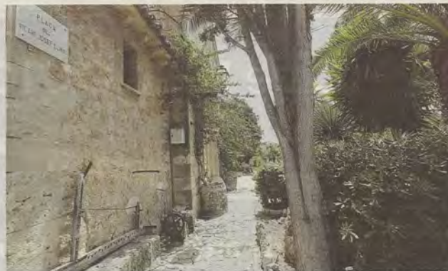
Plaza que atestigua que esta ha sido una plaza pública, según defienden los vecinos.