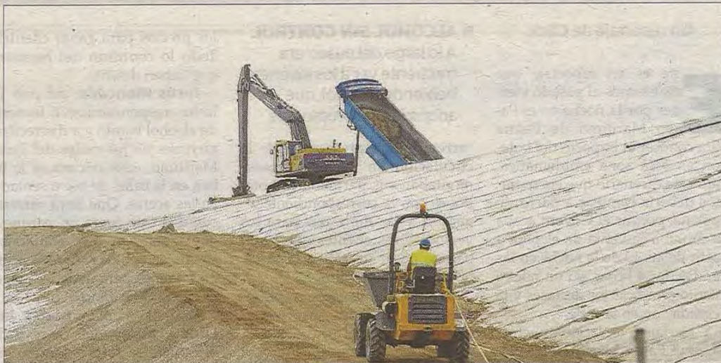
Solar donde se lleva a cabo el tratamiento de escorias en Son Reus.

La Conselleria de Medio Ambiente del Govern tiene conocimiento del caso de posible contaminación del acuífero de Son Reus desde 2008, y en 2009 ya alertó a los vecinos de dos pozos cercanos al vertedero de que no utilizaran el agua.