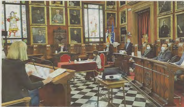
Moilanen en su intervención de ayer ante la comisión del pleno.