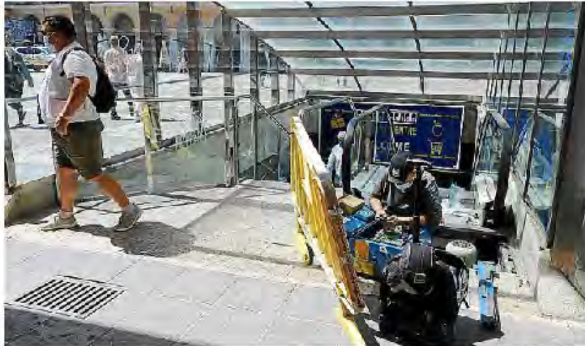
Repairing the escalators. 12-05-2021

2021-05-13 Palma By Majorca Daily Bulletin reporter