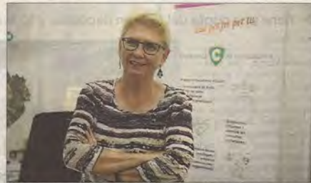
La defensora de la Ciudadanía, Anna Moilanen.

La defensora de la Ciudadanía puso de relieve las dificultades de los vecinos en los procesos participativos, así como la necesidad de facilitar la atención presencial para los ciudadanos.