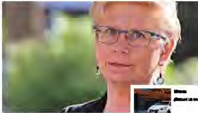
La Defensora Anna Mollamen.

La Defensora de la Ciudadanía, Anna Mollamen, ha recibido una «auténtica avalancha» de quejas en las últimas semanas procedentes de los colegios de la ciudad por el frío que los alumnos deben aguantar en las aulas, por el exceso de aforo en los buses de la EMT que ponen en peligro la salud de los usuarios y por la falta de vigilancia en el cumplimiento de los horarios de cierre de los establecimientos y en el toque de queda, algo que se agrava en especial en determinadas barriadas como el de las viviendas sociales del Camp Redó.